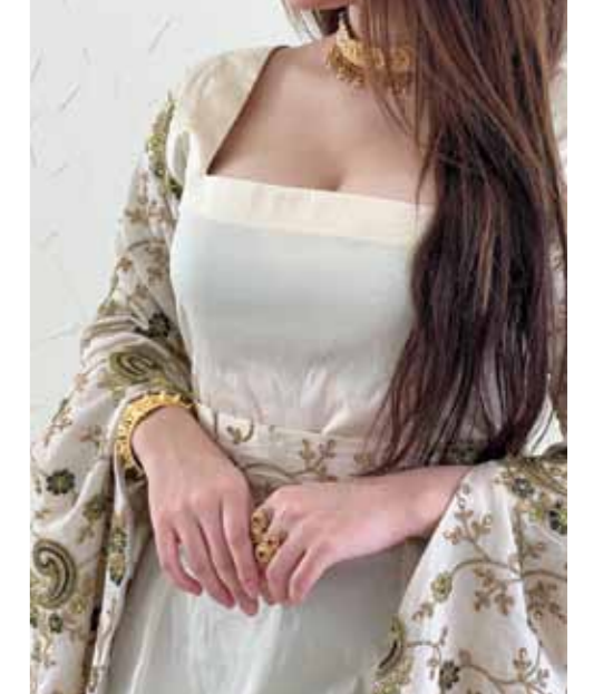
تنوع تصاميمها بين ملابس السفر والعمل والفساتين وملابس الحيف واليوم