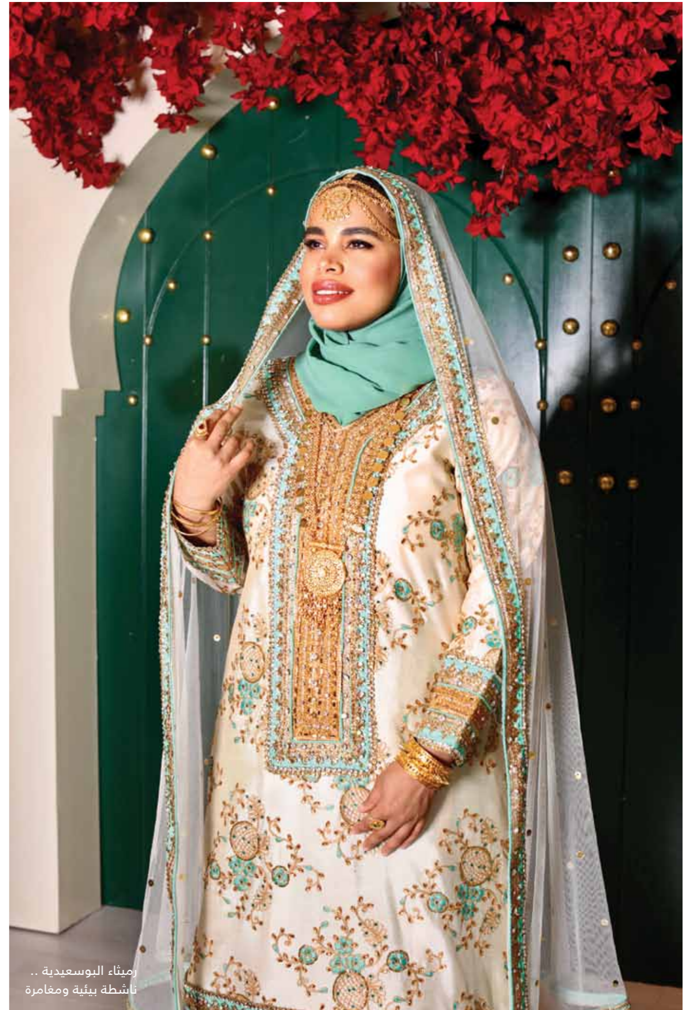
أميئة البوسعيدية .. ناشطة بيئية ومغامرة