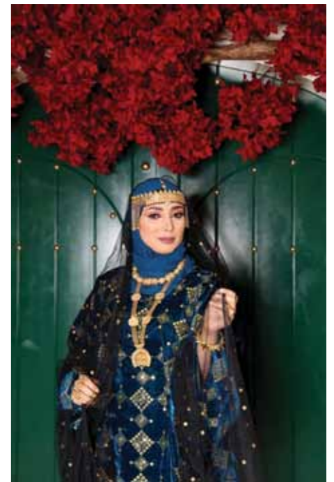
الإعلامية مشاعل القاسمية

تعزيز هذا التولكشن الخاص بيوم المرأة بألوانه وقوسه المتنوع التي تعبر عن التنوع الثقافي في الولايات والمحافظات المختلفة في السلطنة.