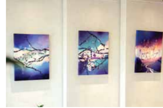
الفن فهو شغف وحوابة منذ الصغر وكان هدفي هو توظيف هذه الزاوية عن طريق الفنانين بمختلف المدارس الفنية المتعددة من نوعها، وتشرفنا بضم عيادتنا للوحات منالين عوامين محظورتين على الساحة المحلية والعالمية.

ما الصعوبات التي واجهتها أثناء بناء هذا المشروع وكيف تمكنت من التغلب عليها؟ التحديات موجودة دائما وخصوصا عند إنشاء مشروع فريد من نوعه، لكنني لم أترك أي صعوبة تقف في وجه تحقيق أهدافي. فلا شيء يأتي بدون تعب وجهد، ف وراء كل نجاح هناك ليالٍ طويلة من العمل الجاد والتفكير العميق والاجتهاد المتواصل. بالرغم من التحديات التي واجهتها، إلا أنني لم أسمح لها بالتغلب على همتي واجتهادي، فقد كان التقدم تدريجياً من خلال التركيز على حلول لكل صعوبة بشكل منفصل، ولم أؤجل أي جانب من العمل إلى وقت آخر.